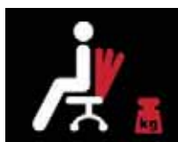
Anpressdruck der Rückenlehne

Optional: 7 cm Sitztiefeinstellung mit Verkürzung der Sitzfläche