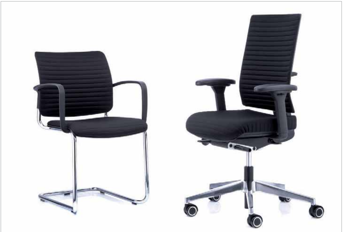
CONSITO® und ANTEO® TUBE