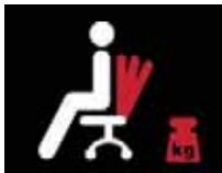
Anpressdruck der Rückenlehne

Optional: 7 cm Sitztiefeinstellung mit Verkürzung der Sitzfläche