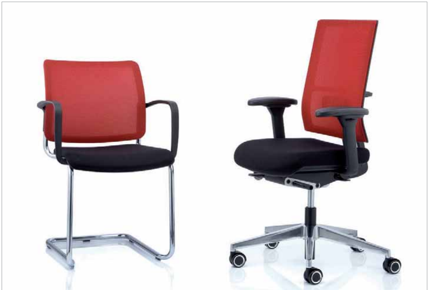
CONSITO® und ANTEO® NETWORK