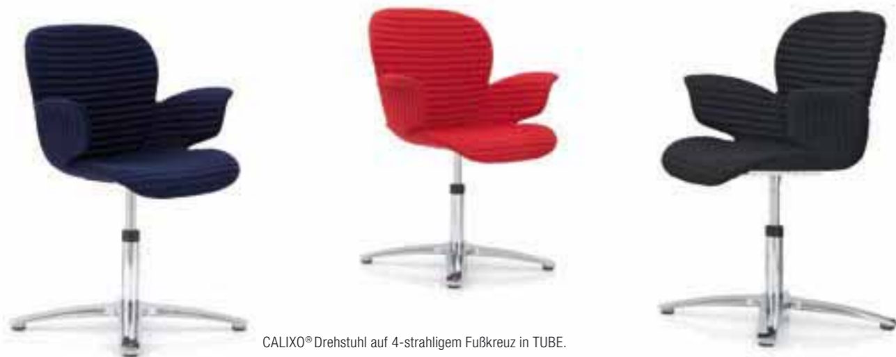
CALIXO® Drehstuhl auf 4-strahligem Fußkreuz in TUBE. CALIXO® Draaistoel op vierpoot voetenkruis in volledige TUBE stoffering.