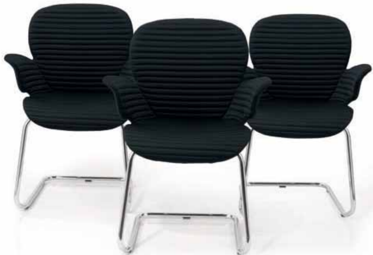
CALIXO® Schwingergestell stapelbar. Gestell in Chrom oder Schwarz. Schale in Schilfgrün, Silbergrau-Metallic oder Naturweiß. Mit Sitzpolster oder TUBE.

CALIXO® stapelbare sledeframe, met een onderstel in chroom of zwart. Schaal leverbaar in licht groen, zilvergrijs metallic of natuur wit. Met zitopdekje of gestoffeerd in TUBE.