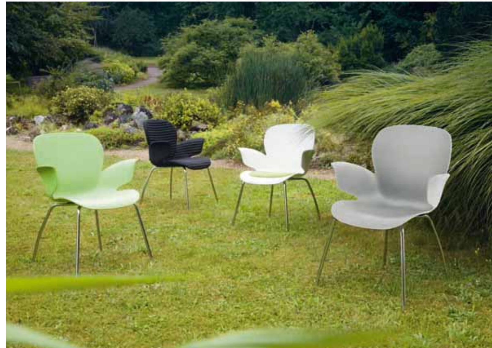
CALIXO® Vierbeinstuhl. Gestell in Chrom oder Schwarz Schale in Schilfgrün, Silbergrau-Metallic oder Naturweiß. Mit Sitzpolster oder TUBE. CALIXO® vierpootstoel, met een onderstel in chroom of zwart. Schaal leverbaar in licht groen, zilvergrijs metallic of natuur wit. Met zitopdekje of gestoffeerd in TUBE.