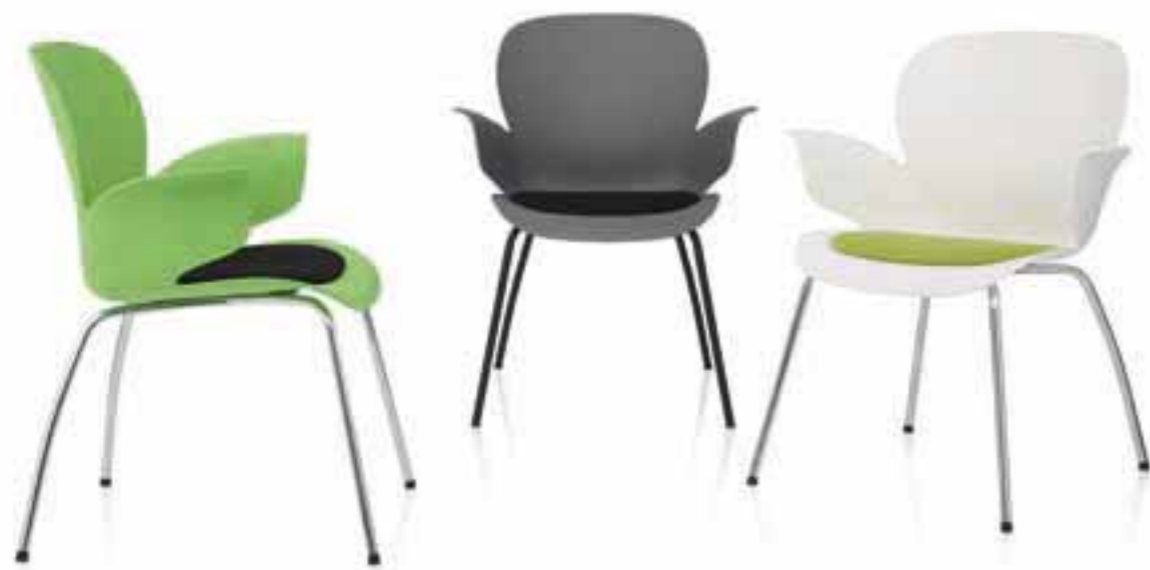
CALIXO® Vierbeinstuhl mit Sitzpolster. CALIXO® Vierpootstoel met zitopdekje.