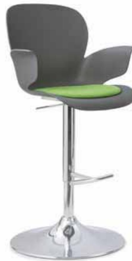
CALIXO® Counter. Höheneinstellbar mit Tellerfuß verchromt. Schale in Schilfgrün, Silbergrau-Metallic oder Naturweiß. Mit Sitzpolster oder TUBE.

CALIXO® stapelbare sledeframe, met een onderstel in chroom of zwart. Schaal leverbaar in licht groen, zilvergrijs metallic of natuur wit. Met zitopdekje of gestoffeerd in TUBE.