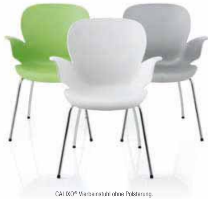
CALIXO® Vierbeinstuhl ohne Polsterung. CALIXO® Vierpootstoel zonder stoffering.