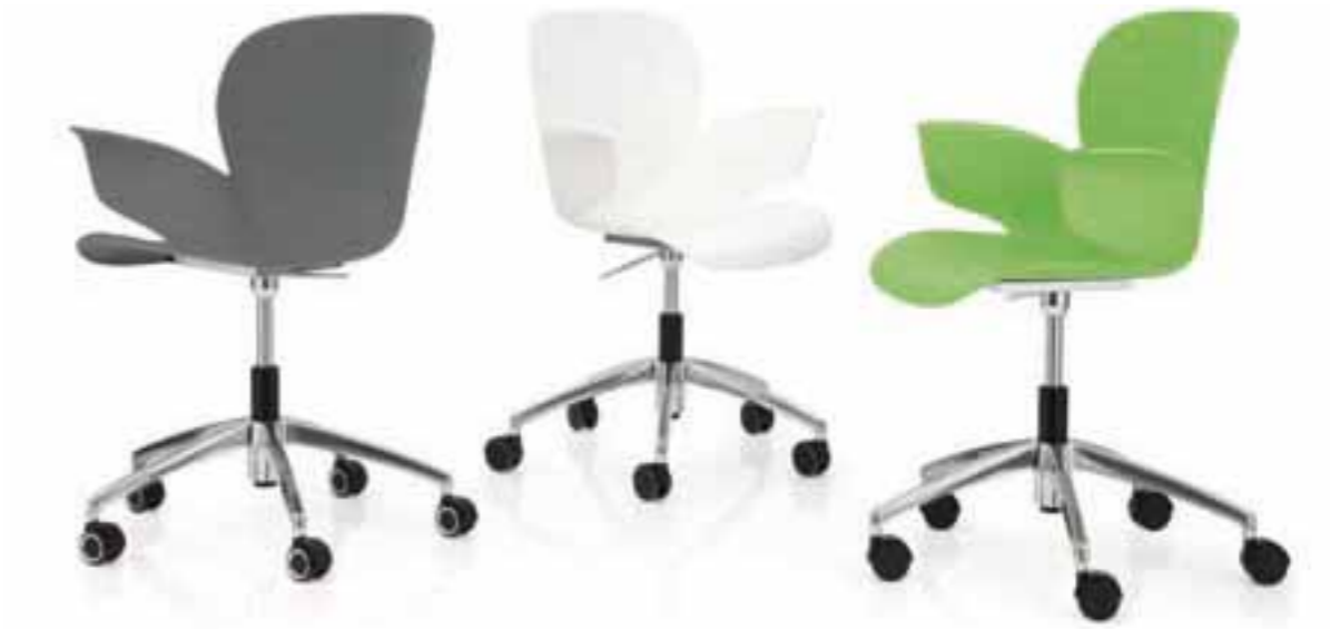
CALIXO® Drehstuhl höhereinstellbar auf Rollen ohne Polsterung. CALIXO® In hoogte verstelbare draaistoel op wielen, zonder stoffering.

CALIXO® in hoogte verstelbare draaistoel op wielen. Aluminium voetenkruis. Schaal leverbaar in licht groen, zilvergrijs metallic of natuur wit. Met zitopdekje of gestoffeerd in TUBE.