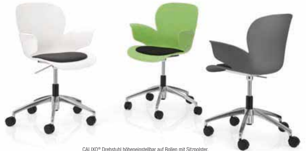
CALIXO® Drehstuhl höhereinstellbar auf Rollen mit Sitzpolster. CALIXO® In hoogte verstelbare draaistoel op wielen, met zitopdekje.