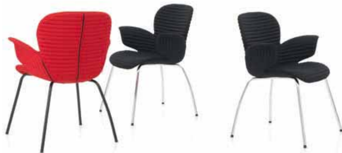
CALIXO® Vierbeingestell in TUBE. CALIXO® Vierpoot in volledig gestoffeerd in TUBE.