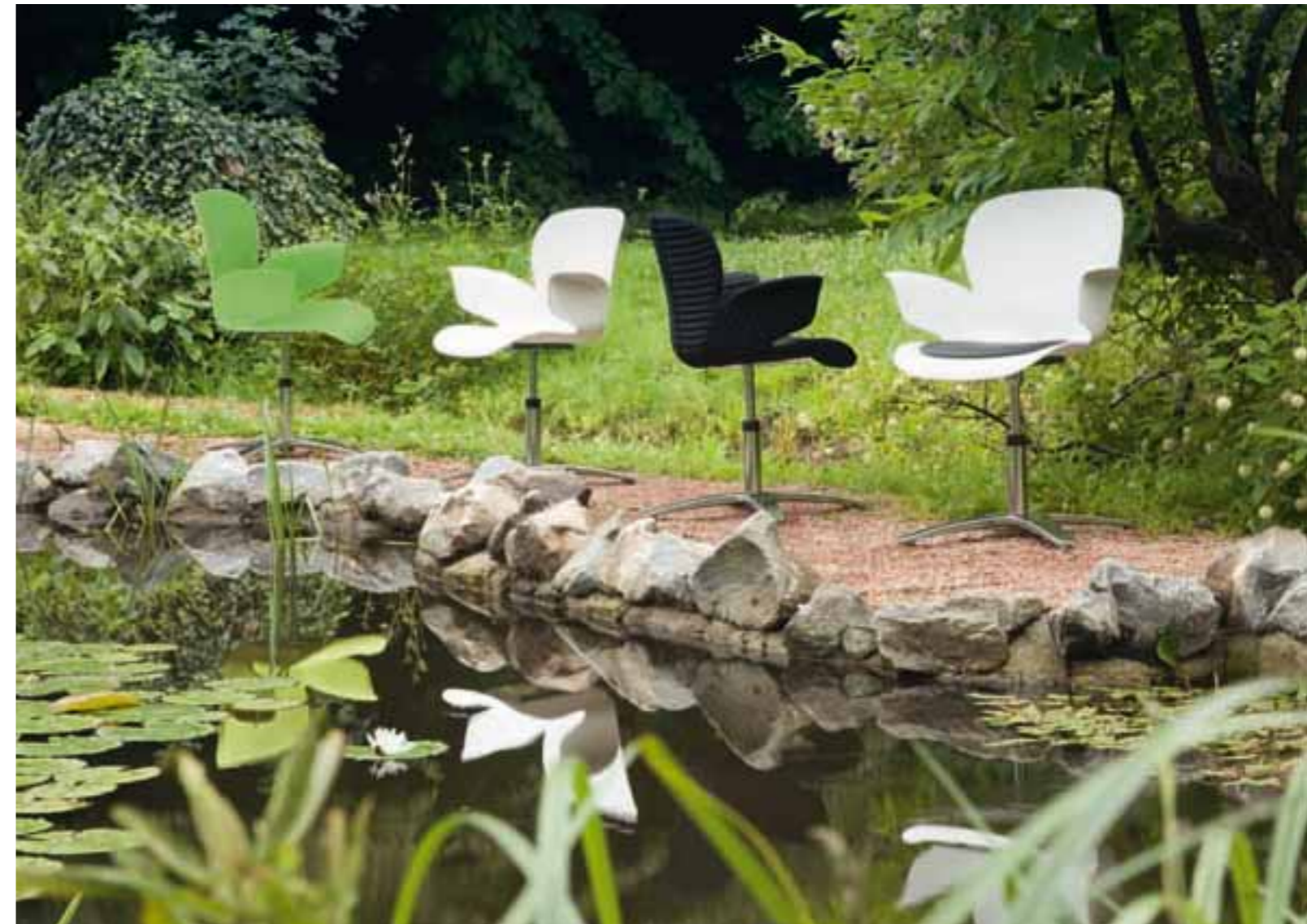
CALIXO® Drehstuhl auf 4-strahligem Aluminiumfußkreuz poliert. Schale in Schilfgrün, Silbergrau-Metallic oder Naturweiß. Mit Sitzpolster oder TUBE. CALIXO® Draaistoel op een vierpoot aluminium gepolijst voetenkruis. Schaal leverbaar in licht groen, zilvergrijs metallic of natuur wit. Met zitopdekje of gestoffeerd in TUBE.