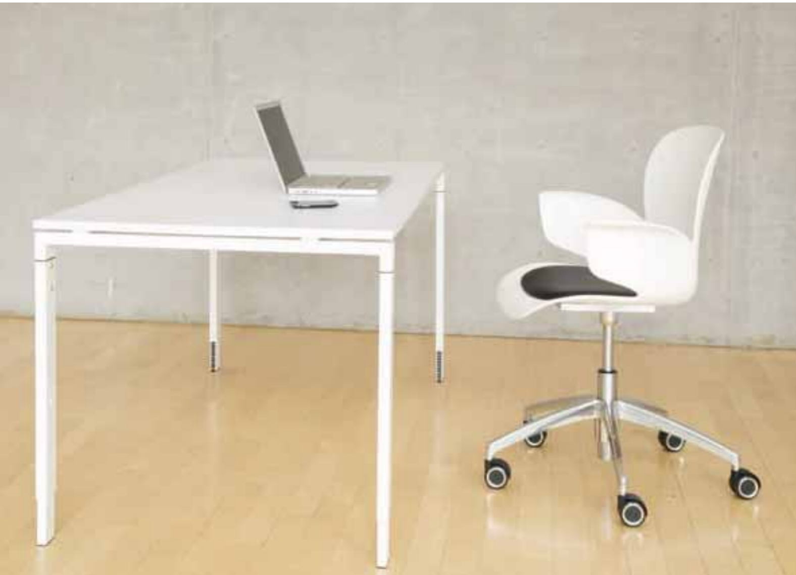
CALIXO® Drehstuhl höhenstellbar auf Rollen. Schale Naturweiß mit Sitzpolster. CALIXO® bureaustoel, hoogte instelbaar op wielen. Schaal in natuur wit met zitopdekje.