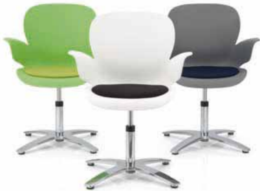
CALIXO® Drehstuhl auf 4-strahligem Fußkreuz mit Sitzpolster. CALIXO® Draaistoel op vierpoot voetenkruis, met zitopdekje.