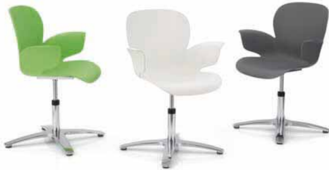
CALIXO® Drehstuhl auf 4-strahligem Fußkreuz ohne Polsterung. CALIXO® Draaistoel op vierpoot voetenkruis, zonder stoffering.