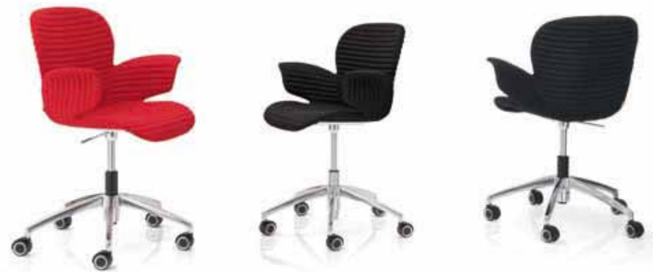
CALIXO® Drehstuhl höhereinstellbar auf Rollen in TUBE. CALIXO® In hoogte verstelbare draaistoel op wielen in volledige TUBE stoffering.