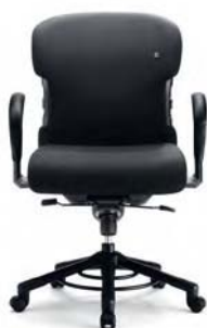
O 652 Rückenlehnenhöhe 56 cm

Auf alle Modelle des XXXL gewährt Interstuhl eine Langzeitgarantie von fünf und eine Vollgarantie von drei Jahren.