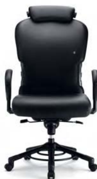
O 665 Rückenlehnenhöhe 78 cm