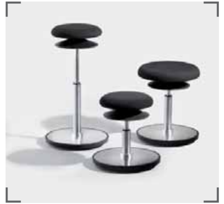
ERGO 1 und ERGO 2