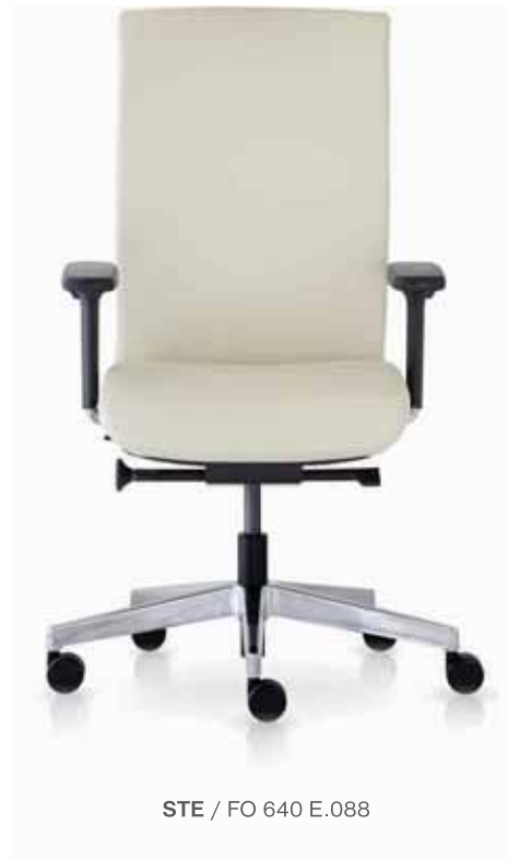
STE / FO 640 E.088