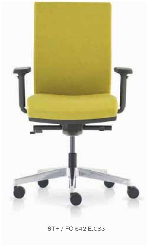
ST+ / FO 642 E.083