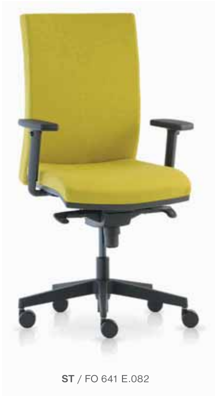
ST / FO 641 E.082