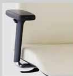
088 / područky výškově (10 cm), šířkově (8 cm), hloubkově (6 cm) stavitelné, oboustranné výkyvné o 30° 088 / armrests height - (10 cm), width - (8 cm), depth - adjustable (6 cm) in two ways 30° swivel range on both sides