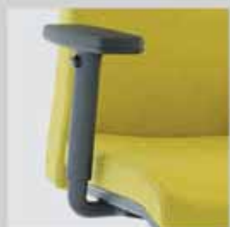
082 / výškově stavitelné (8 cm) područky 082 / height - adjustable (8 cm) armrests