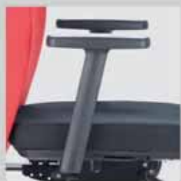
090 / pevné područky 090 / fixed armrests