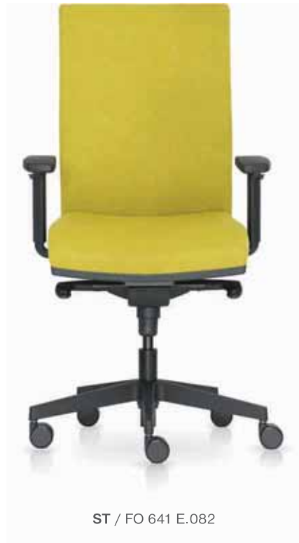
ST / FO 641 E.082