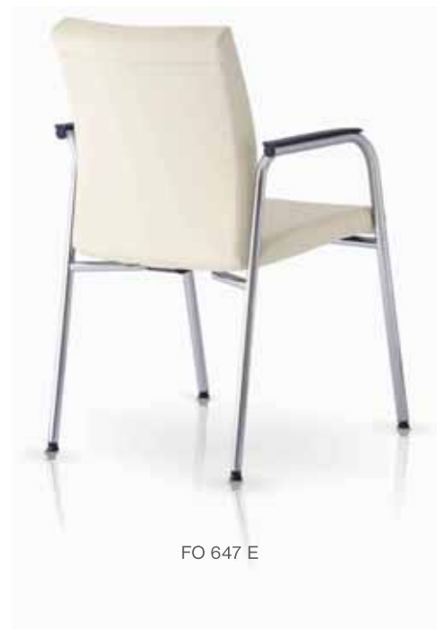
FO 647 E