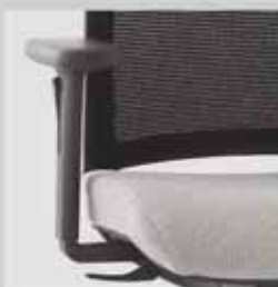
099 / výškově (10 cm) a šířkově (7 cm) stavitelné područky 099 / height - adjustable (10 cm) and depth - adjustable (7 cm) armrests