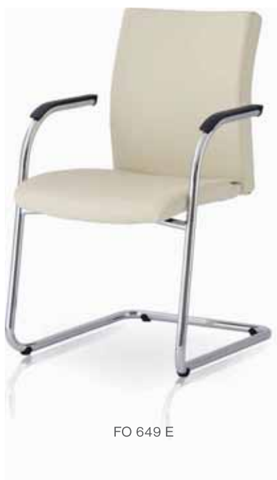
FO 649 E