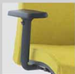
083 / područky výškově (8 cm), šířkově (6 cm), hloubkově (6 cm) stavitelné 083 / armrests height - (8 cm), width - (6 cm), depth - adjustable (6 cm)