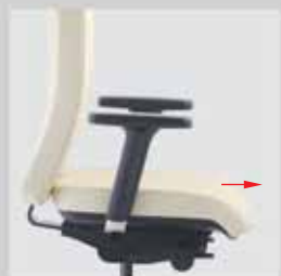
Nastavení hloubky sedáku (6 cm) Seat depth - adjustment (6 cm)