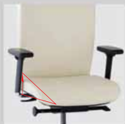
Náklon sedáku Seat - tilt adjustment (-3°) (FO 640 E, FO 642 E)