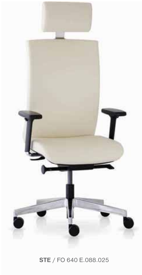
STE / FO 640 E.088.025