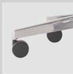
Kříž leštěný alu Polished aluminium base