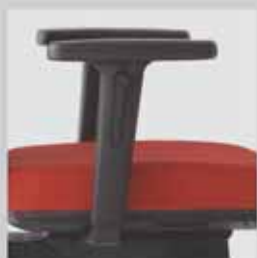
091 / výškově stavitelné (10 cm) područky 091 / height - adjustable (10 cm) armrests