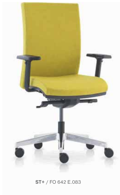
ST+ / FO 642 E.083