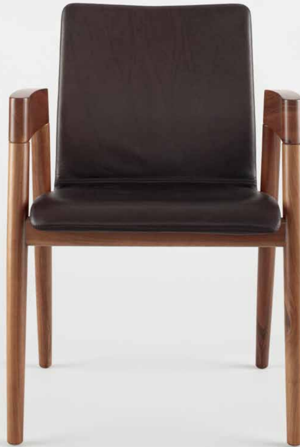
: holzer Sessel HZ 1001, 5 mm gepolstert, Nussbaum, Polster E 347 Anilinleder Braun

/ Sitzschale aus sechs Lagen Buche furniert – individuell in der Löffler Manufaktur gepolstert.