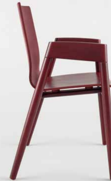
: holzer Sessel HZ 1000, Sitzschale Sichtholz, Buche bordeaux