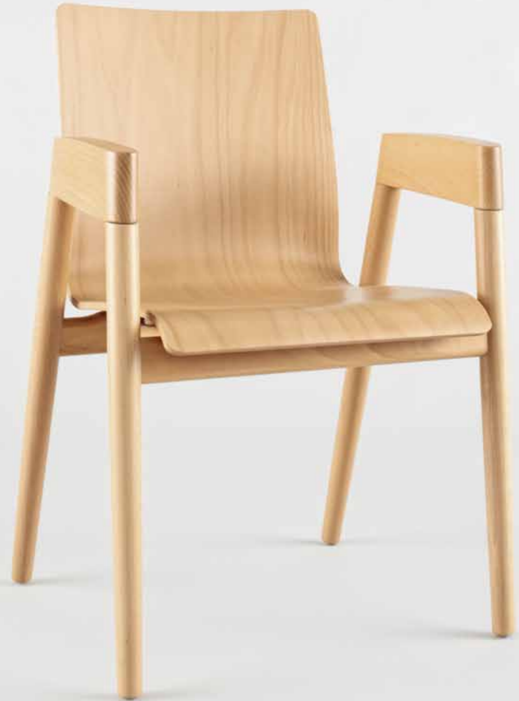
: holzer Sessel HZ 1000, Sitzschale Sichtholz, Buche natur

holzer / für Zuhause, für das Büro und im Restaurant.