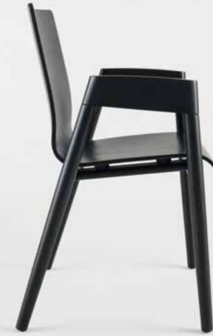
: holzer Sessel HZ 1000, Sitzschale Sichtholz, Buche schwarz

/ die mit der Bein konstruktion verbundene Armlehne ist der Inbegriff schöner Form.