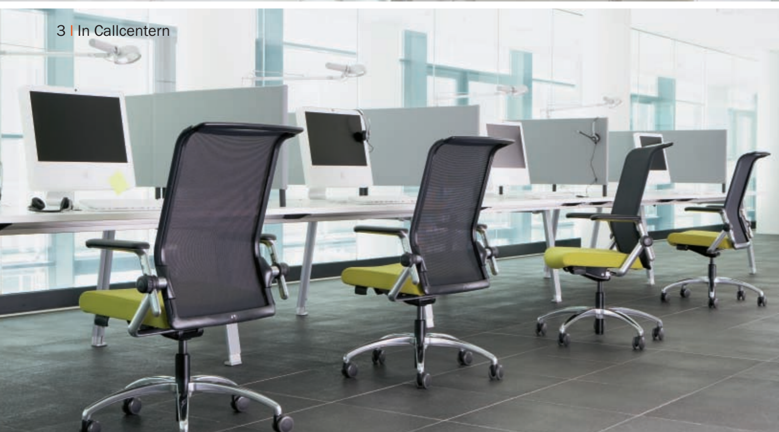
3 | In Callcentern