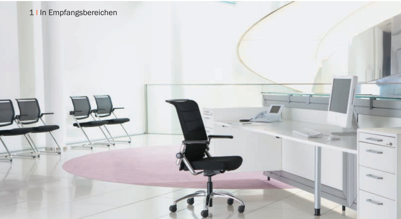
1 | In Empfangsbereichen