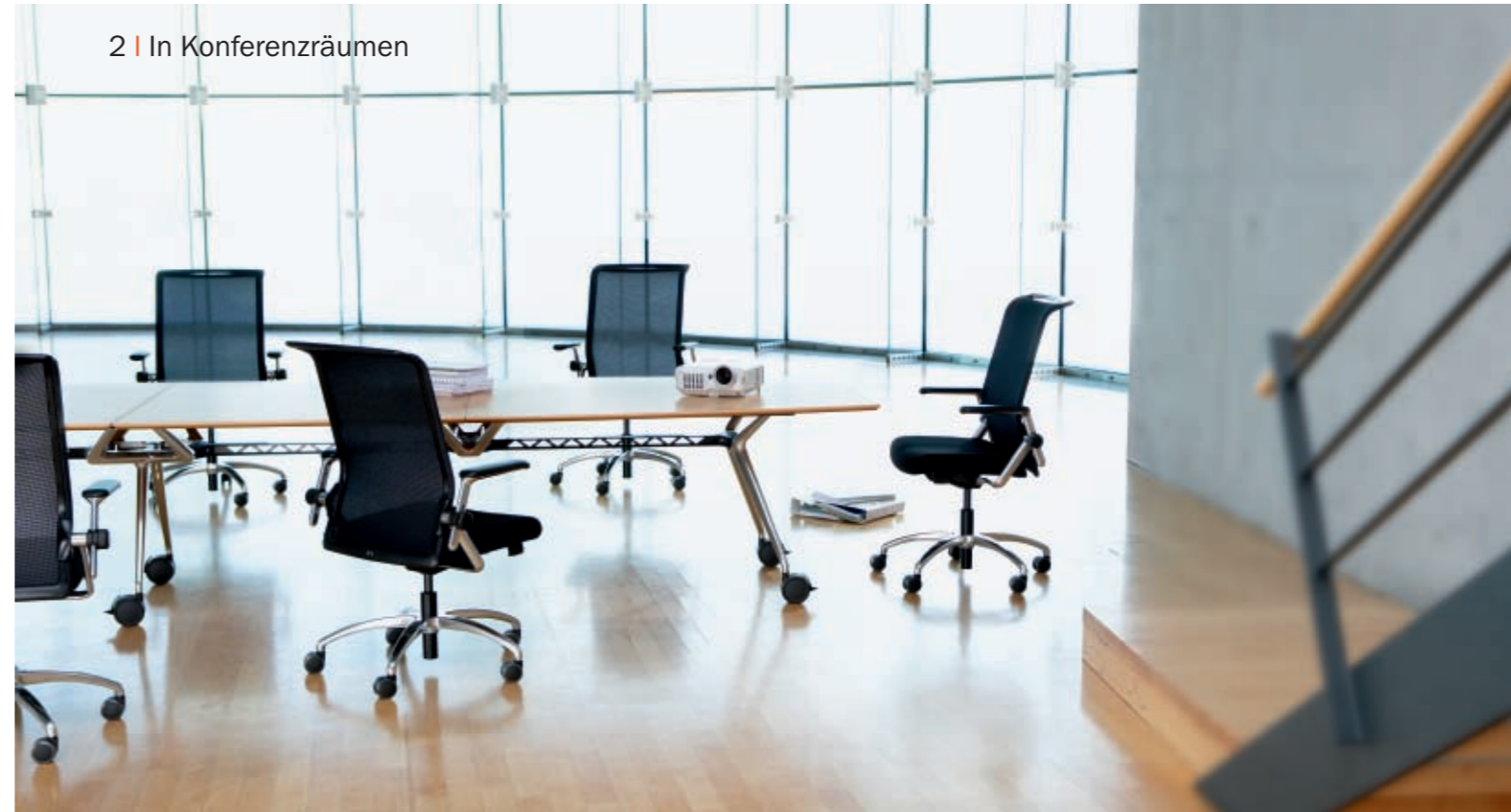
2 | In Konferenzräumen