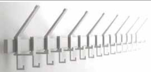
Wand- und Reihen-Garderoben