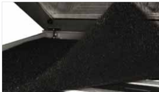
Grobfilter Abstandsmatte entfernen

Schritt 5: Grobfilter Abstandsmatte entfernen