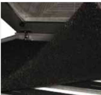
Grobfilter Abstandsmatte Best.-Nr.: 59RS 2000-130