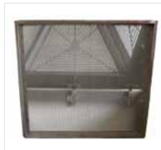
Grobfilter Metall Best.-Nr.: 59RS 2000-132