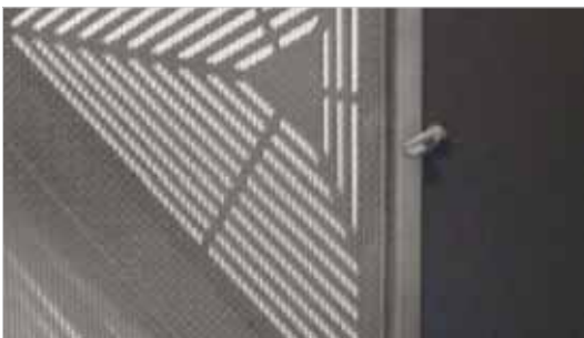
Vier Drehriegel öffnen

Schritt 3: Grobfilter Metall entfernen (Je nach Raumbeschaffenheit öfter zu reinigen)