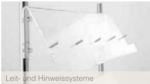
Leit- und Hinweissysteme