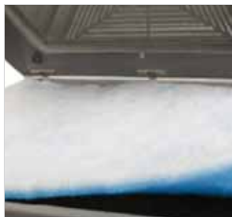
Vorfilter weiß/blau Best.-Nr.: 59RS 2000-131