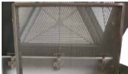
Grobfilter Metall entfernen