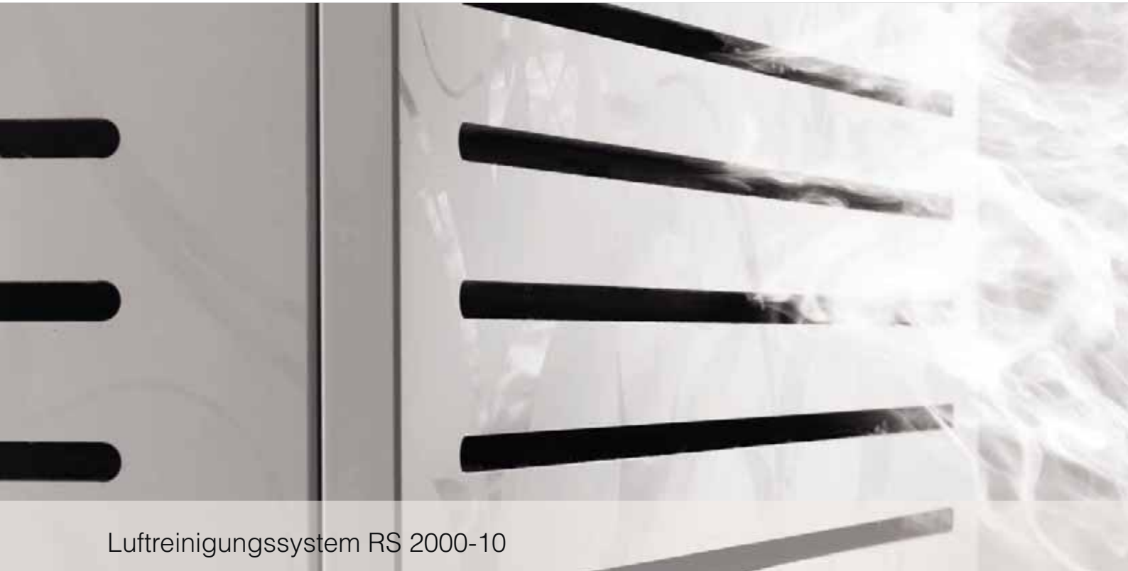
Luftreinigungssystem RS 2000-10