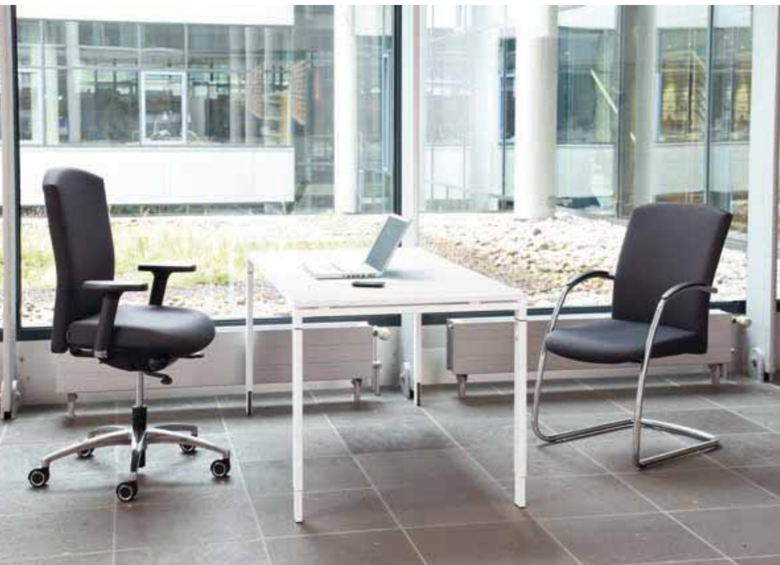
SELLEO® Drehstuhl in Volllausstattung. Bezugsstoff: Climatex® Anthrazit.

SELLEO® Draaistoel in volledige uitvoering. Stoffering: Climatex® Antraciet.