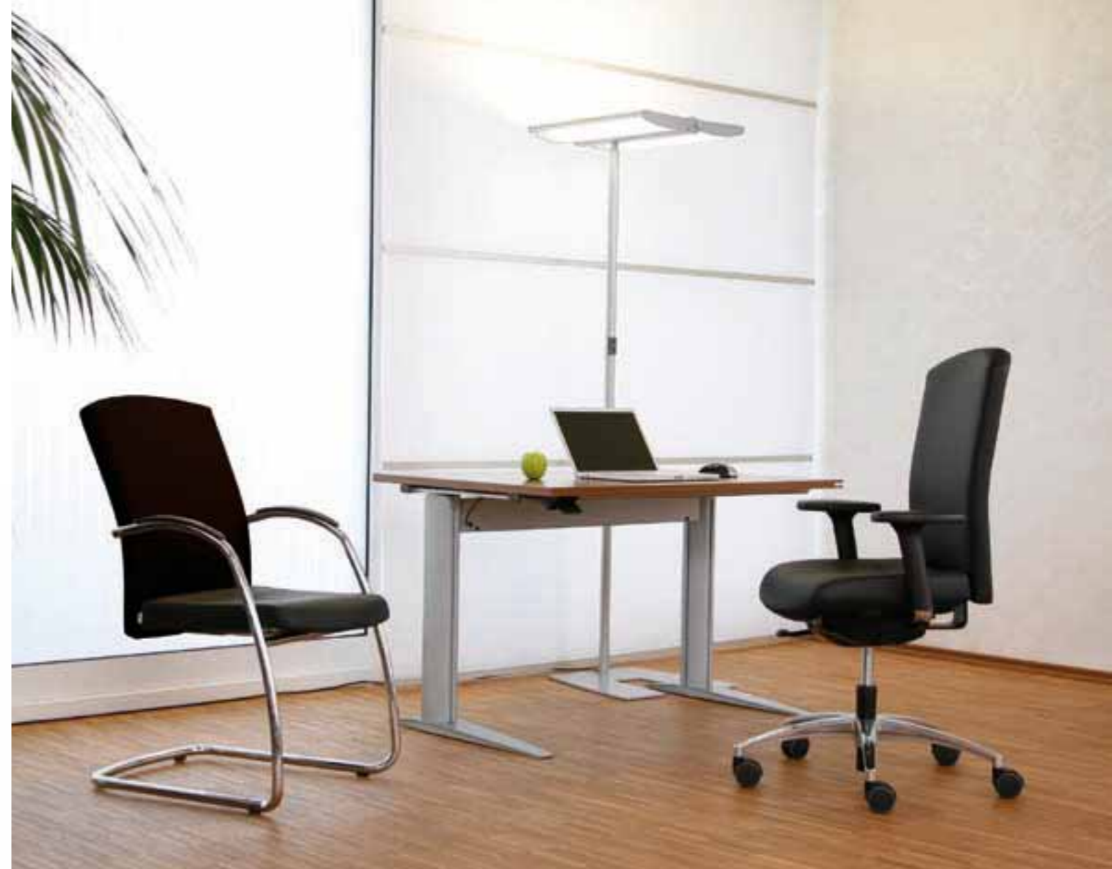
SELLEO® Conferentie-draaistoel met glijders en terugkeer techniek. Alternative: Voetenkruis met wielen, terugkeer techniek en hoogte instelling.