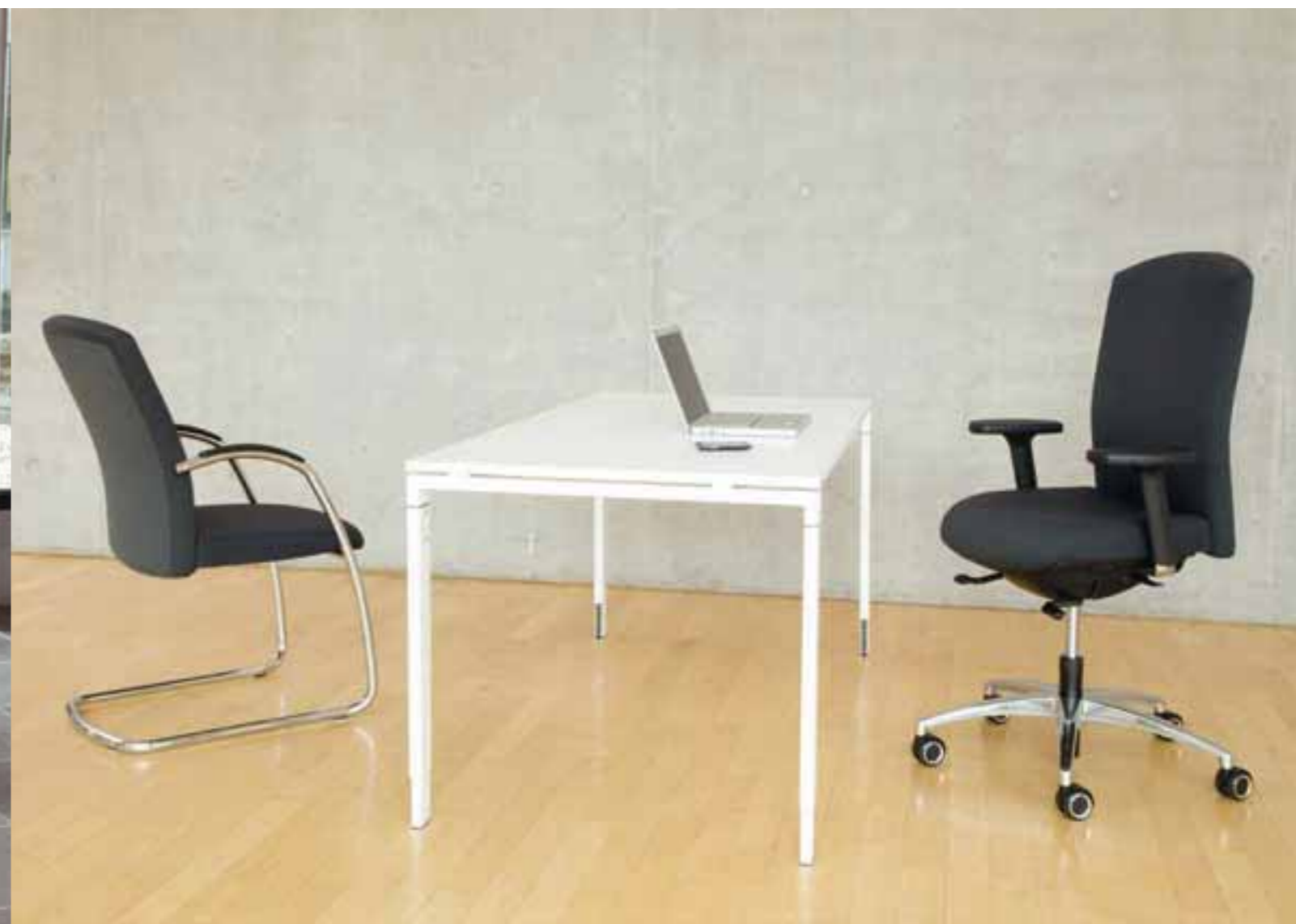
SELLEO® Konferenz- und Besuchersessel. Bezugsstoff: Climatex® Anthrazit.

SELLEO® Conferentie- en bezoeker stoel. Stoffering: Climatex® Antraciet.