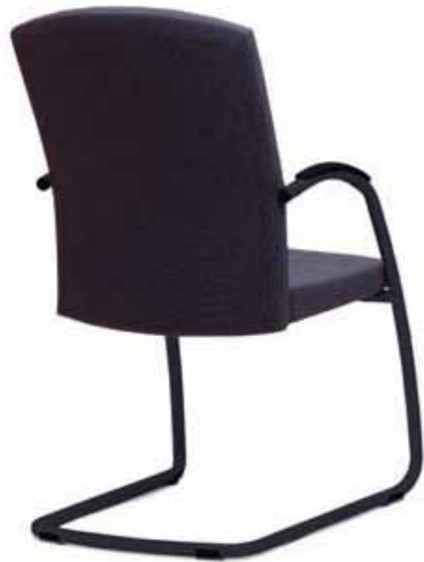
SELLEO® Schwinger in Vollpolsterung. SELLEO® sledeframe, volledig gestoffeerd.