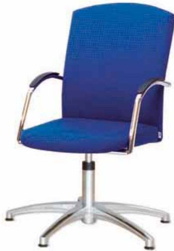
SELLEO® Konferenz-Drehsessel mit Rückschwing-Technik auf Gleiter. Alternative: Fußkreuz mit Rollen, Rückschwing-Technik und höhenstellbar.