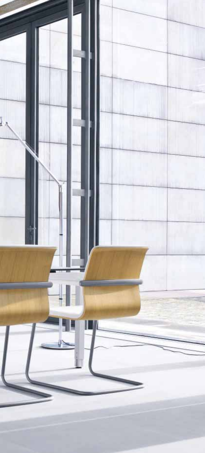
Besuchersstuhl/ Visitor chair: T-SEV22-Do