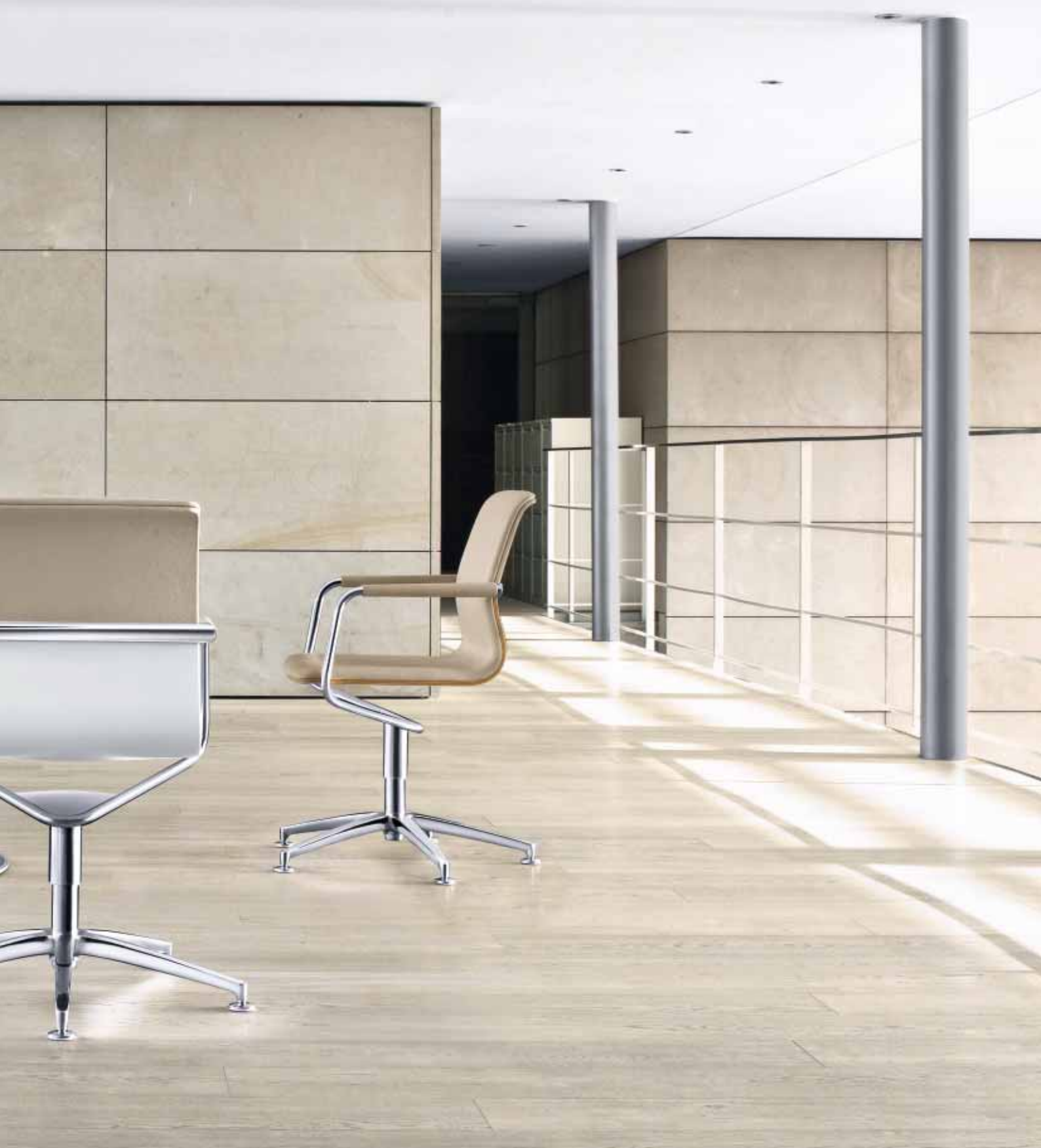
Konferenzdrehstuhl/ Conference swivel chair: T-SEgo-Do Tisch/Table: MartinStoll