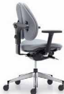
duo back® 12 | Vollpolsterrücken