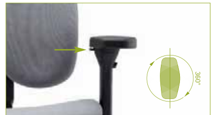
Armlehnenpad | Um 40 mm verschiebbar und 360° drehbar.