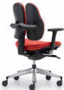
duo back® 11 | Rückenkappe in Kunst- stoff schwarz