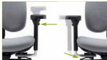
Multifunktionsarmlehne | Auf Tastendruck 100 mm höhenverstellbar und 90 mm breitenverstellbar