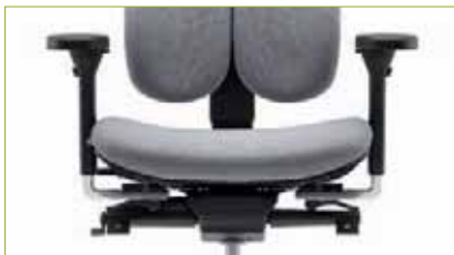
Gewichtseinstellung | Per Kurbel individuell einstellbar von 45 - 125 kg