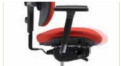
Schiebesitz | Zur Einstellung der Sitztiefe.