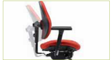
Synchronmechanik | Mit einem Öffnungswinkel 22°. Verhältnis 1:1,8