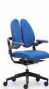
xenium-basic duo back®

Nach jedem Geschmack Wir haben das duo back® Prinzip auch in anderen Stuhlfamilien zum Einsatz gebracht.