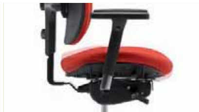
Sitzneigeverstellung | Optionale Sitzneigeverstellung mit 0° und 4° Vorneigung.

Durch die beiden flexiblen Rückenflügel und die Synchronmechanik unterstützt der Stuhl optimal die individuelle Bewegungsfreiheit. In allen Arbeitspositionen sitzen Sie hervorragend, der Körper wird schalenförmig umschlossen und perfekt abgestützt.