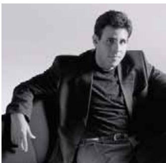
Design: Daniel Figueroa

De zorgvuldig geselecteerde materialen maken van salida een tijdloos en duurzaam product, dat zonder problemen gerecycled kan worden.